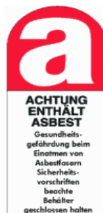
Warnhinweis nach UVV