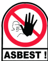
Verbotsschild nach den Unfall-Verhütungsvorschriften (UVV)