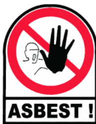
Verbotsschild nach den Unfall-Verhütungsvorschriften (UVV)